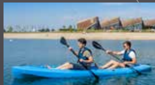
SIT ON TOP